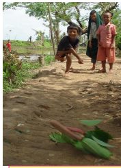
ထန်းတစ်ပင်ရွာလမ်းမပေါ်တွင် ကစားနေသောကလေးများ

နာဂဓိကဏ္ဍ ၃ မင်းအောင်သက်လွင် နှစ်ထောင့်ရှစ် ရဲ့ ဇွန်လ မှာ လေကြီး မိုးကြီး ပြင်းထန်လာ ပင်လယ်ပြင်က လှိုင်းဂယက် ၊ အုန်းပင် လောက်ထိ သူ မြင့်တက် ခန့်တ နဲ့ လူ တိရစ္ဆာန် ၊ လှိုင်းလေ ထဲမှာ ပလူပျံ ကယ်ပါ ယူပါ တစ်အော်လဲ ၊ လှိုင်းလေထဲမှာ လည်ကာ ဝဲ။ ခိုကိုးရာမဲ့ အသက်ပိညာဉ် ၊ ဆွဲမိ ဆွဲရာ ကောက်ရိုးမျှင် အုတ်တိုက် ကျောင်းတွင်း နိုင်လဲ ၊ အုတ်ပုံ ပြိုကာ ပိကာ လဲ သေဆုံးသွားတဲ့ ပိညာဉ်တွေ ၊ ကောင်းရာ မှန်ရာ ရောက်ပါစေ ။ နှုတ်မြှောက်ကာလေ ဆုမွန် 'တ' ၊ ရှင်သော သူတွေ နောင်တ 'ရ' မေ့ မရတဲ့ ဖြစ်ရပ်မှန် ၊ ရင်တွင်းထဲက ခေါင်းလောင်းသံ ကန္တာပျက်တဲ့ မှန်တိုင်းည ၊ 'နာဂဓိကြီး' လို့ အမည် ရ ဘဝ ဆိုတဲ့ ခနတာ ၊ တိုတောင်း လွန်းသဏ္ဍာ ဆင်ခြင်မိတာ 'သာဓက' ၊ ဘယ်အရာ မဆို 'အနတ္တ' ရှင်သန် ခန ဘဝမှာ ၊ ကောင်းရာ မှန်ရာ ကျင့်ကြံပါ ။ မှတ်ယူကာလေ ဆင်ခြင်ကြ ၊ 'နာဂဓိကြီး' က သက်သေပြ ။