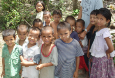
ထန်းတစ်ပင်ရွာမှ ကလေးများ

။ ဝမ်းနဲခြင်းထဲကဝမ်းမြောက်မှု ။ ဆိုးစုငယ် ( L.K ) ဝေလီဝေလင်း နံနက်ခင်း ၊ စိတ်ဓာတ်တွေက ကျလို့ ဆင်း မနက်ခင်းရဲ့သံစဉ်သီချင်း ၊ သူ့အသံနဲ့ ဝေးလို့ ကင်း။ ခေါင်းငိုက်စိုက်ချ ဖြတ်လျှောက်လာ ၊ ကြည့်လိုက်မိတာ စင်ပေါ်မှာ နက်ပြာ အဖုံးနဲ့ စာအုပ်ကများ ၊ ငါ့ကို လက်ယပ်ခေါ်နေသလား။ သေသေချာချာ ကြည့်လိုက်တော့ ၊ အဲဒါ Holy Bible ပေါ့။ ဒီလိုအချိန်မှာ သိလိုက်တာ ၊ ငါဟာ ဘုရားနဲ့ ဝေးကွာစွာ လောကအလယ်မှာ လျှောက်လှမ်းရင်း ၊ ကျမ်းစာနဲ့လဲ ဝေးလို့ ကင်း။ နောင်တများနဲ့ ဝမ်းနဲစွာ ၊ မျက်ရည် သွင်သွင် ကျဆင်းလာ ကိုယ်တော်ဘုရား ခွင့်လွှတ်ပါမလား ၊ ကျမ်းစာအုပ်ကို ဖွင့်လျက်သား။ လူကာ ၁၅:၂၄ ဟာ ၊ ငါ့အတွက်ခွန်အား ဖြစ်စေတာ။ ကိုယ်တော်ရှင်နဲ့ ပြန်လျှောက်ဖို့ ၊ လမ်းမှန်ရောက်အောင် အားပေးလို့။ ကိုးစားရင်းနဲ့အသက်ရှင်မယ် ကျေးဇူးတင်တယ် အိုအရှင်ရယ်။ ။