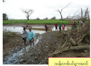
ထန်းတစ်ပင်ရွာအဝင်

(ယခင်လမူအဆက်) ဒီတစ်ခါတော့ ၂၄ရက်နေ့ နဲ့ ပြောင်းပြန်ဖြစ်သွားပါတယ်။ Mobile လူငယ် အဖွဲ့က အစည်းကြီး အောင်မင်္ဂလာနဲ့ အစည်လေးရွာမှာ တစ်နေကုန်ထိုင် ဆေးကုဖို့ တာဝန်ယူပြီး ဆရာဝန်မကြီး သူနာပြုကြီးများ ပါဝင်တဲ့ Stationary အဖွဲ့က နောက်တစ်ရွာ ဖြစ်တဲ့ ထန်းတစ်