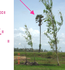
ထန်းတစ်ပင်ရွာမှ ထန်းပင်