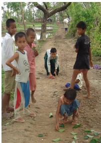
သစ်ရွက်များနှင့် ကစားနေသော ကလေးများ

ငါသောက်တဲ့ရေ ( ဇင်မာ ) ပုဒ်မိစ် လူချမ်းသာတို့ လမ်း၊ နှစ်ဆောင်ပြိုင် ဘန်ဂလိုနဲ့၊ ခန့်ကြွယ် ဂုဏ်မောက်၊ ဘဝင်ကြီးတဲ့ သူဌေးကတော်။ အလှမိနီယံ မှန်တပ်၊ အဲယားကွန်းက လေ ကိုယူ စပါး ( Spa ) ဆိုတဲ့ ဓါတ်စမ်းရေနဲ့ စိမ်၊ အနီပဲခန်းမှာ ငြိမ့်နေပြီး ဂျာမဏီလုပ် ဘီအမ်ဒဘယ်လျူ ကား ( BMW ) နဲ့၊ ဟိတ်ဟန်ကြီး ထုတ်လို့ ဟောလီးဝုဒ်က ဘစ်တနီးစပီးယားရဲ့ ပေါ့ပဲ မှ အာရုံငြိသတဲ့။ သူ့စိတ်ကူး သူ့အရိပ် ဗူထဲမှာတော့ ဒီဘဝမှာ ပြည့်စုံပြီပေါ့။ သူ့ လေဟာနယ်ထဲက၊ မောဟ ဆိုတဲ့အခိုးအငွေ့တွေ ....။ အဲ - သူသောက်တဲ့ ရေက၊ ဩစတြေးလျက ရေသန့်မှတဲ့။ နံချာဆင်းရဲ ငမ္မေ မို့ ငါသည်လည်းပဲ ၊ သူတစ်ပါး စေသမျှ ပြုရတဲ့ အိမ်ဖော် ဘဝ မလှပ ၊ ကြားစရာ ဂုဏ်မရှိ၊ စားစရာက သူတို့ကျန်တာ။ အဲ - ငါသောက်တဲ့ ရေ ကတော့၊ တန်ဖိုးအနုဂ္ဂ အချိန်ဖြန့်ဆုံး စမ်းရေတွေထဲက တစ်စက်နဲ့တင် လုံလောက် ၊ နောက်တစ်ဖန် ပြန်ပြီး မငတ်စေတဲ့ ခရစ်တော် ပေးတဲ့ အခမဲ့ ရေ ၊ ထာဝရ အသက်စမ်းရေတွေလေ။ (ယော ၄:၁၃-၁၄)