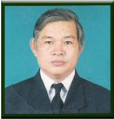
ခမည်းတော်က